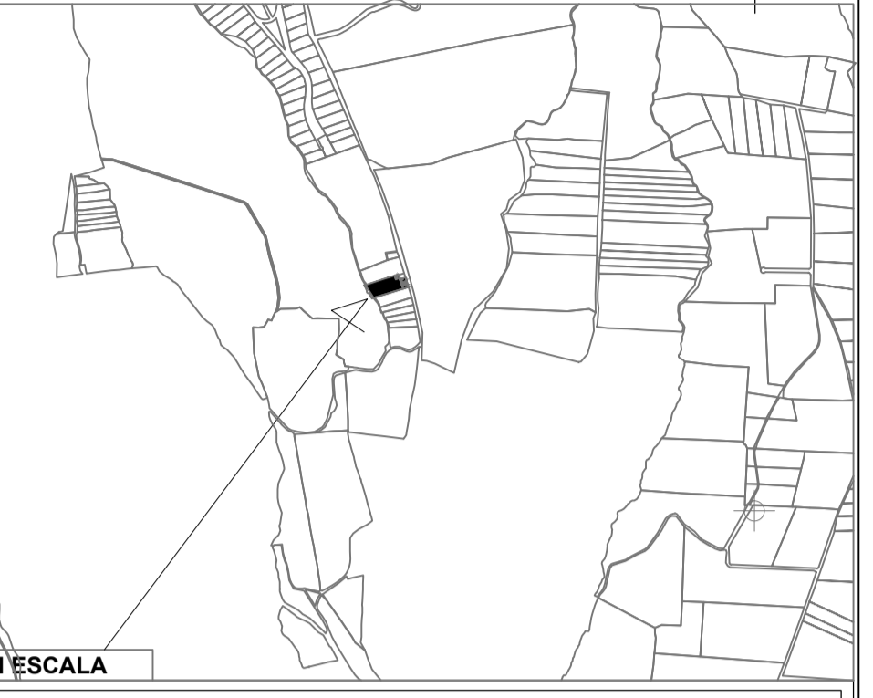
UBICACIÓN SIN ESCALA