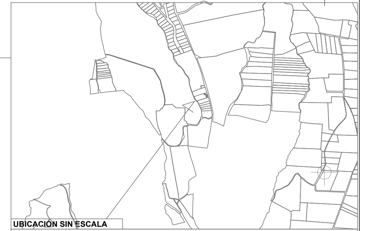
UBICACIÓN SIN ESCALA