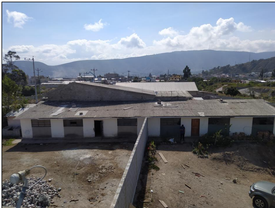
Imagen 2. LINDERO SUR, CERRAMIENTO DE MAPOSTERÍA DE BLOQUE Y COLUMNAS DE HORMIGÓN, IMPLANTADO EN BLOQUE 1 DE CONSTRUCCIÓN.