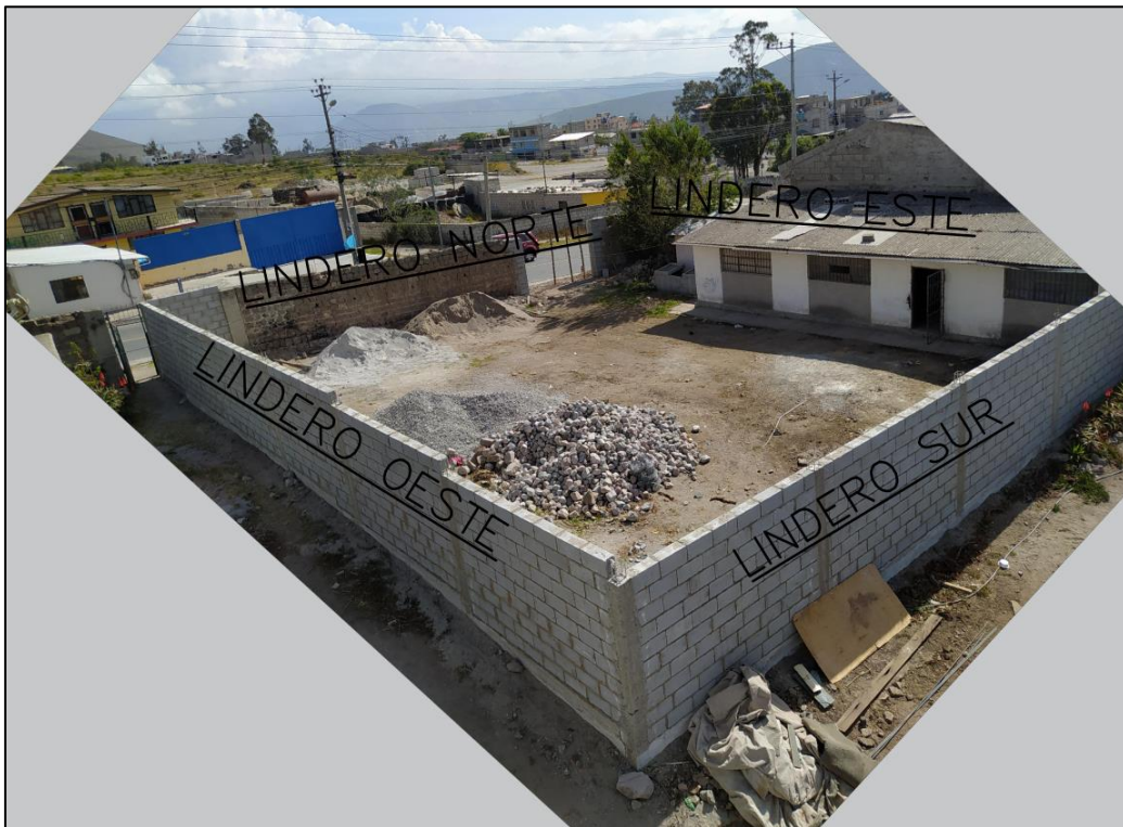
Imagen 6. LINDEROS LOTE, MOTIVO DE PERICIA