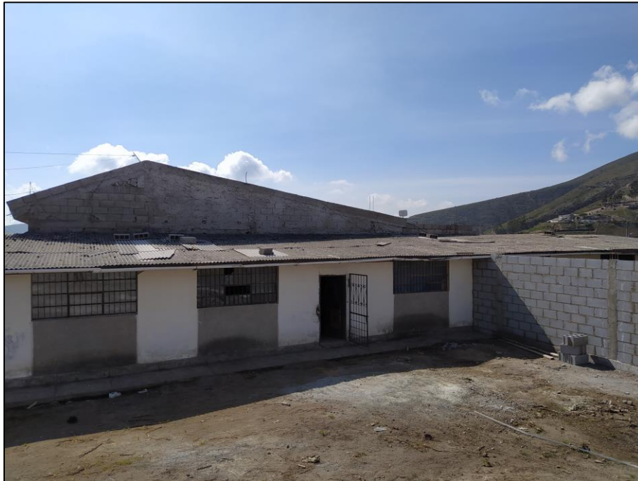
Imagen 3. LINDERO ESTE, FACHADA DE BLOQUE 1 DE CONSTRUCCIÓN, USO DORMITORIOS Y BODEGAS.