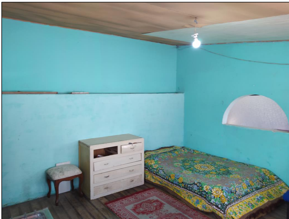
Imagen 4. INTERIOR DE BLOQUE 1 DE CONSTRUCCIÓN, USO DORMITORIO.