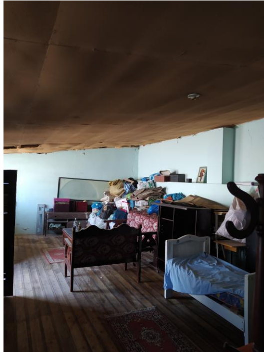
Imagen 5. INTERIOR DE BLOQUE 1 DE CONSTRUCCIÓN, USO BODEGA.