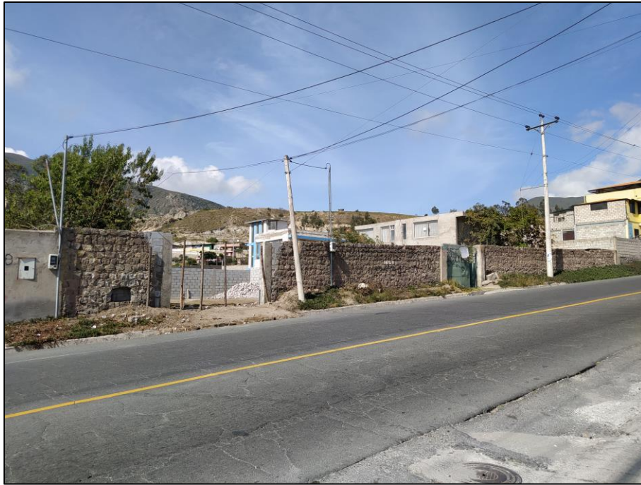
Imagen 1. Cerramiento Lindero Norte, No. De Predio 415254.