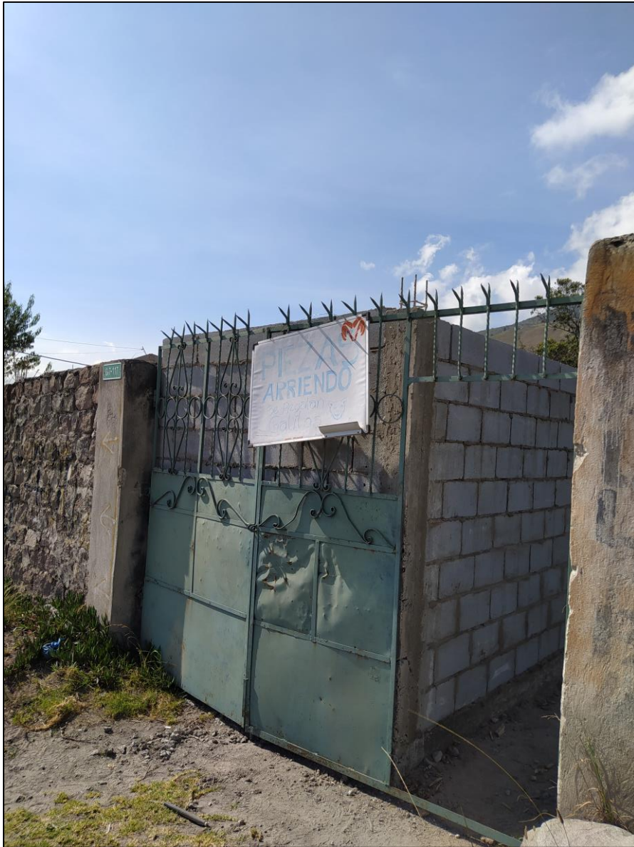
Imagen 7. INGRESO VEHICULAR, PUERTA TAPIADA, CON COLUMNAS DE HORMIGÓN Y MAMPOSTERÍA DE BLOQUE